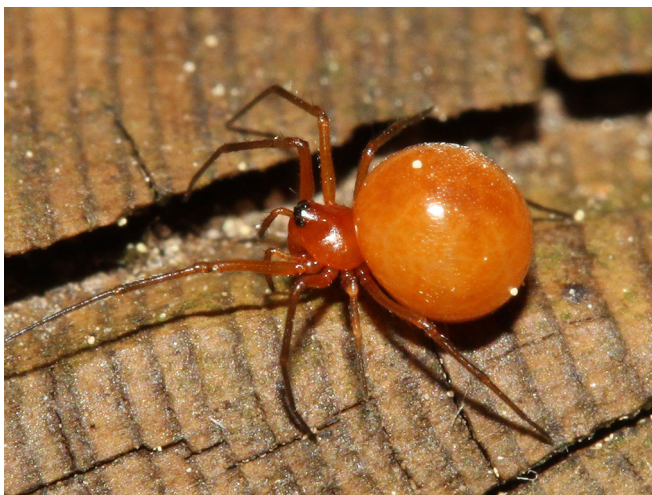
Abb. 6: Nematogmus sanguinolentus (Gallspinnchen, 1,7–2,5 mm) scheint mit dem leuchtend orangen, kugeligen Hinterkörper eine Pflanzengalle nachzuahmen

Nematogmus sanguinolentus – Gallspinnchen: es scheint mit seinem leuchtend orangen, kugeligen Hinterkörper eine Pflanzengalle nachzuahmen