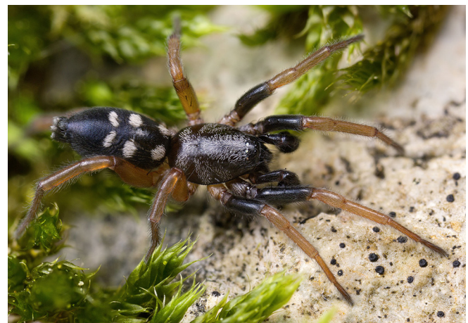
Abb. 2: Der Sechsfleck-Spion ( Phaeoedus braccatus , 4–7 mm) zeigt seine Flecken besonders deutlich

Bei den Männchen vieler Zwergspinnen (Linyphiidae: Eriogoninae) ist die Kopfregion des Prosomas in bizarre Formen modifiziert, die sich erst unter Vergrößerung in ihrer ganzen Komplexität zeigen. Diese artspezifischen Strukturen spielen wohl in vielen Fällen eine Rolle bei der Paarung und waren Anregung für zahlreiche der hier vorgeschlagenen Populärnamen (Abb. 3).