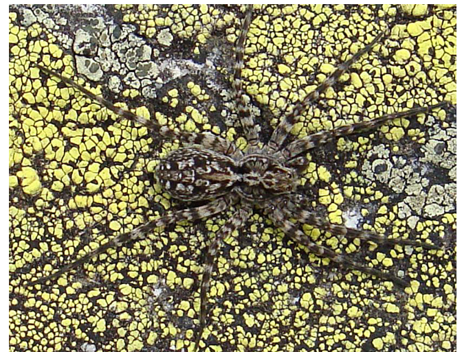
Abb. 7: Der Blockhalden-Stachelwolf ( Acantholycosa norvegica sudetica , 6–9 mm) in seinem Vorzugsbiotop. Die charakteristischen Stacheln auf den Beinen sind vor dem Flechtenhintergrund nur schwer zu sehen

Alopecosa farinosa – Pfingst-Scheintarantel: der Artname ist eine Übernahme aus dem Niederländischen (pinksterpanterspin) und bezieht sich auf den subtilen Unterschied