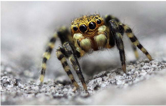
Abb. 11: Das Männchen des Gewöhnlichen Ringelbeinspringers ( Talavera aequipes , 2–3 mm) zeigt deutlich die namensgebende Ringelung der Beine

Fig. 11: The male of Talavera aequipes clearly displays the annulation of the legs that is characteristic for its genus