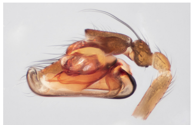
Abb. 4: Diplostyla concolor (Trompetenspinne, 2,5–3 mm); der Pedipalpus des Männchens zeigt in der Seitenansicht die geschwungene Trompetenform besonders schön. Was hier aussieht wie das Rohr eines Blech Instruments ist tatsächlich der Embolus des Begattungsorgans, der bei der Paarung zur Spermaübertragung dient

Helophora insignis – Nagelweber: nach der langen, schmalen Form der Epigyne; dieser Name wurde bereits von Menge