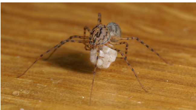
Abb. 12: Weibchen der Gewöhnlichen Speispinne ( Scytodes thoracica , 3–6 mm) tragen ihren Eikokon an den Kieferklauen

Euryopis quinqueguttata – Fünffleck-Ameisenkugelspinne: der wissenschaftliche Artname weist auf fünf Flecken hin,