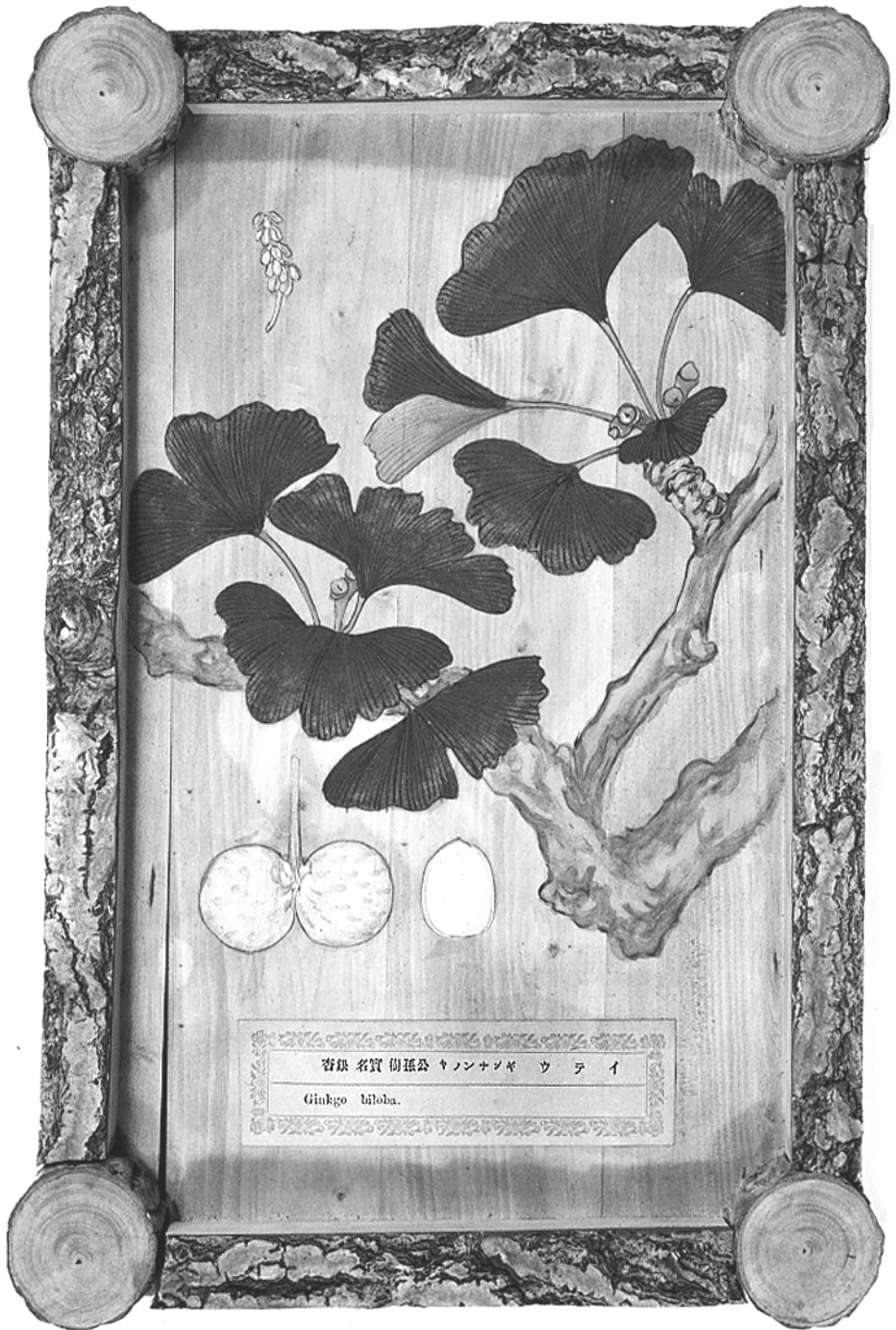
Fig. 2. Ginkgo biloba L. – anonyme Abbildung auf Ginkgo Holz, c.1875. – Botanisches Museum Berlin-Dahlem.