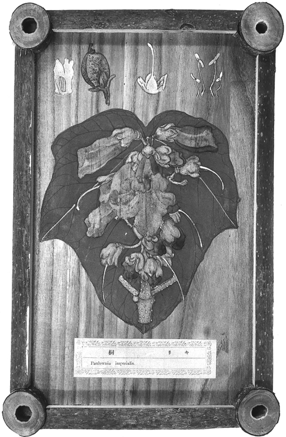
Fig. 1. Paulownia tomentosa (Thunb.) Steud. – anonyme Abbildung auf Paulownia Holz, c. 1875. – Botanisches Museum Berlin-Dahlem.