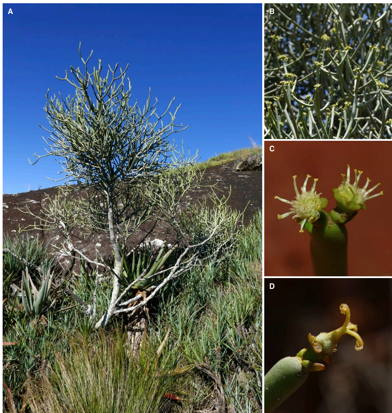
Fig. 4. – Euphorbia alaicornis Baker. A. Plant mâle adulte photographié à Manerinerina; B. Détail des glomérules de cyathes; C. Fleurs mâles; D. Fleur femelle.