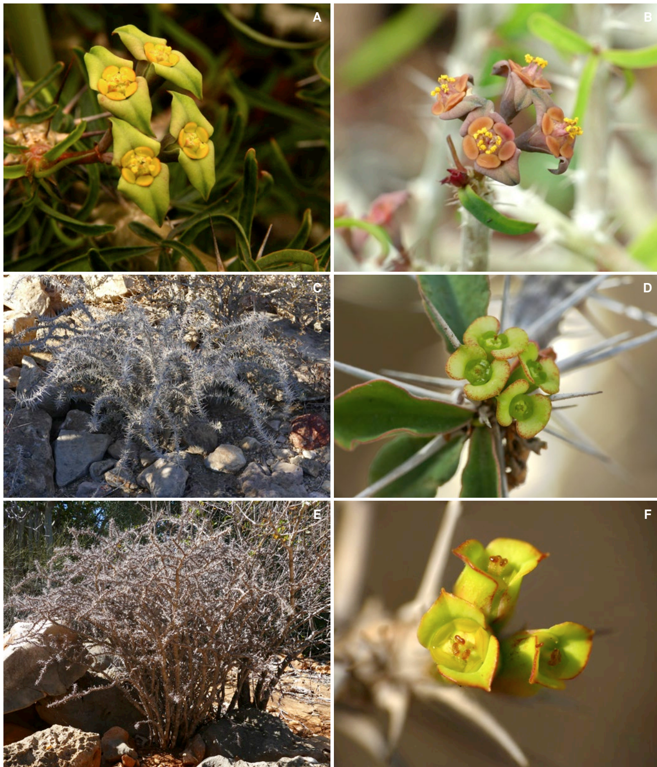
Fig. 1. – Euphorbes épineuses du sud-ouest malgache. A–B. Euphorbia neobosseri Rauh; C–D. Euphorbia mahafalensis var. itampolensis (Rauh) J.-P. Castillon & J.-B. Castillon; E–F. Euphorbia mahafalensis Denis du lac Tsimanampetsotsa.