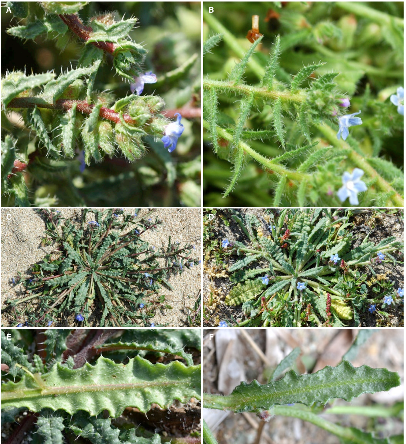
Fig. 2. – A. Anchusa crisper subsp. valincoana Paradis, Piazza & Quilichini: tiges florifères; B. Anchusa crisper Viv. subsp. crisper : tiges florifères; C. Anchusa crisper subsp. valincoana : individus fleuris; D. Anchusa crisper subsp. crisper : individus fleuris; E. Anchusa crisper subsp. valincoana : face inférieure d'une feuille; F. Anchusa crisper subsp. crisper : face inférieure d'une feuille.