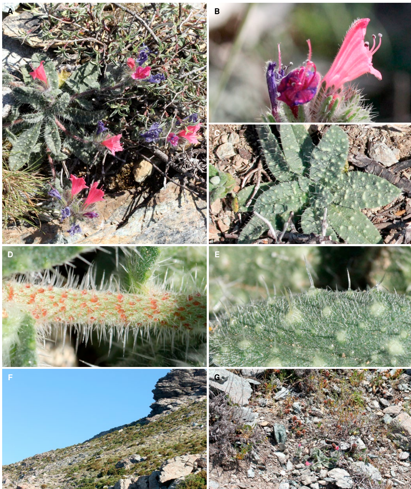
Fig. 2. – Echium montenielluense Delage. A. Inflorescence et rosette; B. Détail d'une cyme; C. Rosette; D. Détail de l'indument de la tige; E. Détail de l'indument du limbe; F. Vue générale de l'habitat au Monte Niellu; G. Détail de l'habitat.