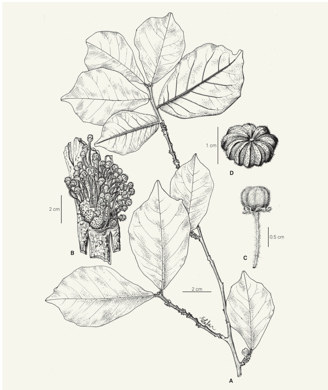
Fig. 2. – Turraea cauliflora J.-F. Leroy & Lescot ex Randrianari. & Callm. A. Rameau; B. Fruits immatures; C. Détail d'un fruit immature; D. Fruit mature.

[ A, D: Randrianarivony et al. 463, TAN; B, C: Service Forestier 22188, TAN] [Dessin: R.L. Andriamiarisoa]