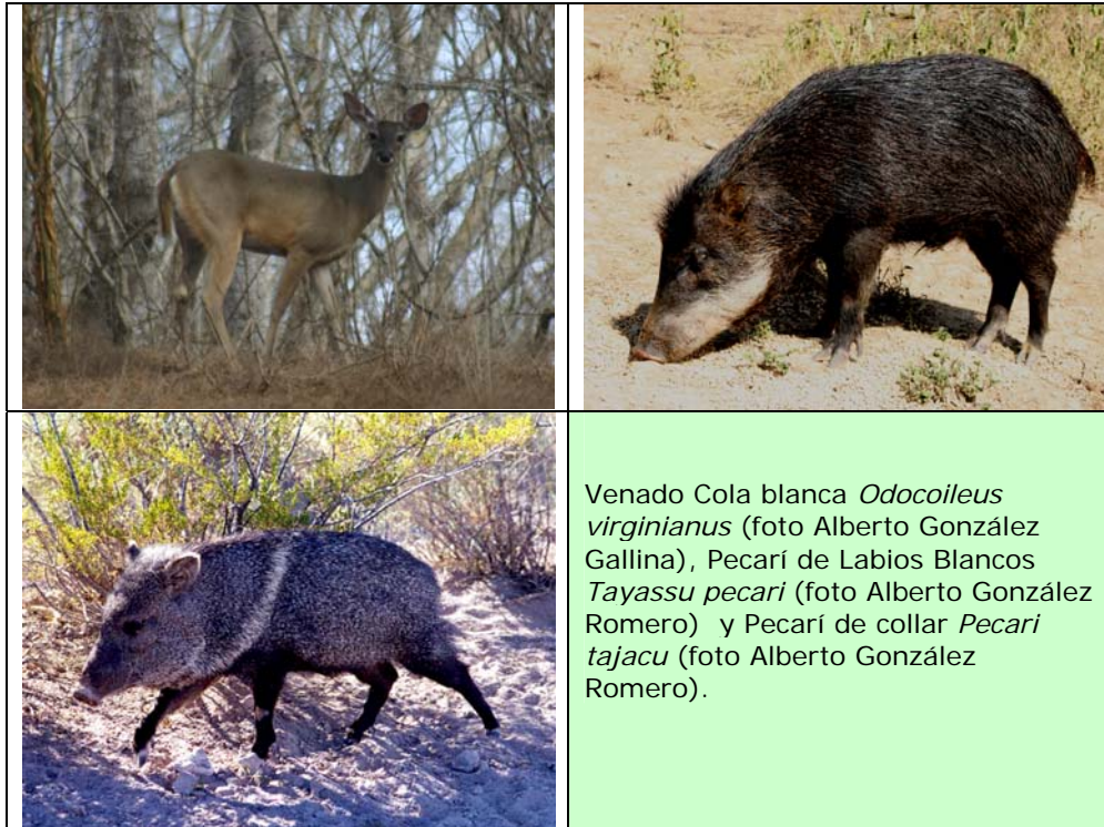
Venado Cola blanca Odocoileus virginianus (foto Alberto González Gallina), Pecarí de Labios Blancos Tayassu pecari (foto Alberto González Romero) y Pecarí de collar Pecari tajacu (foto Alberto González Romero).

presentaron 11 trabajos abarcando siete de las once especies de ungulados en México, además de dos trabajos donde se incluye a los cerdos asilvestrados y al ciervo rojo. Las especies abordadas fueron: tapir, borrego cimarrón, wapití, venados temazates rojo y café, venado cola blanca, pecarí de labios blancos y pecarí de collar. Como resultado de dicho evento, en este número especial de la revista Tropical Conservation Science se presentan en extenso nueve de dichos trabajos. Estos trabajos llevados a cabo en diferentes partes del país abordan temas de actualidad y permitirán al lector interesado en la conservación y manejo, tener un panorama de como se encuentra este grupo importante de mamíferos en México.