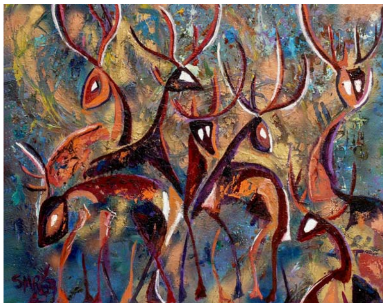
Reproducción de pintura artística de la serie "Venados". Técnica mixta sobre tela montada en madera. Medidas 110 x 90 cm. Autor: Salvador Mandujano Rodríguez. Año 2007.

† Cervus canadensis (Erxleben, 1777) de acuerdo a otros autores. Ver Gallina y Escobedo-Morales [29] en este mismo número.